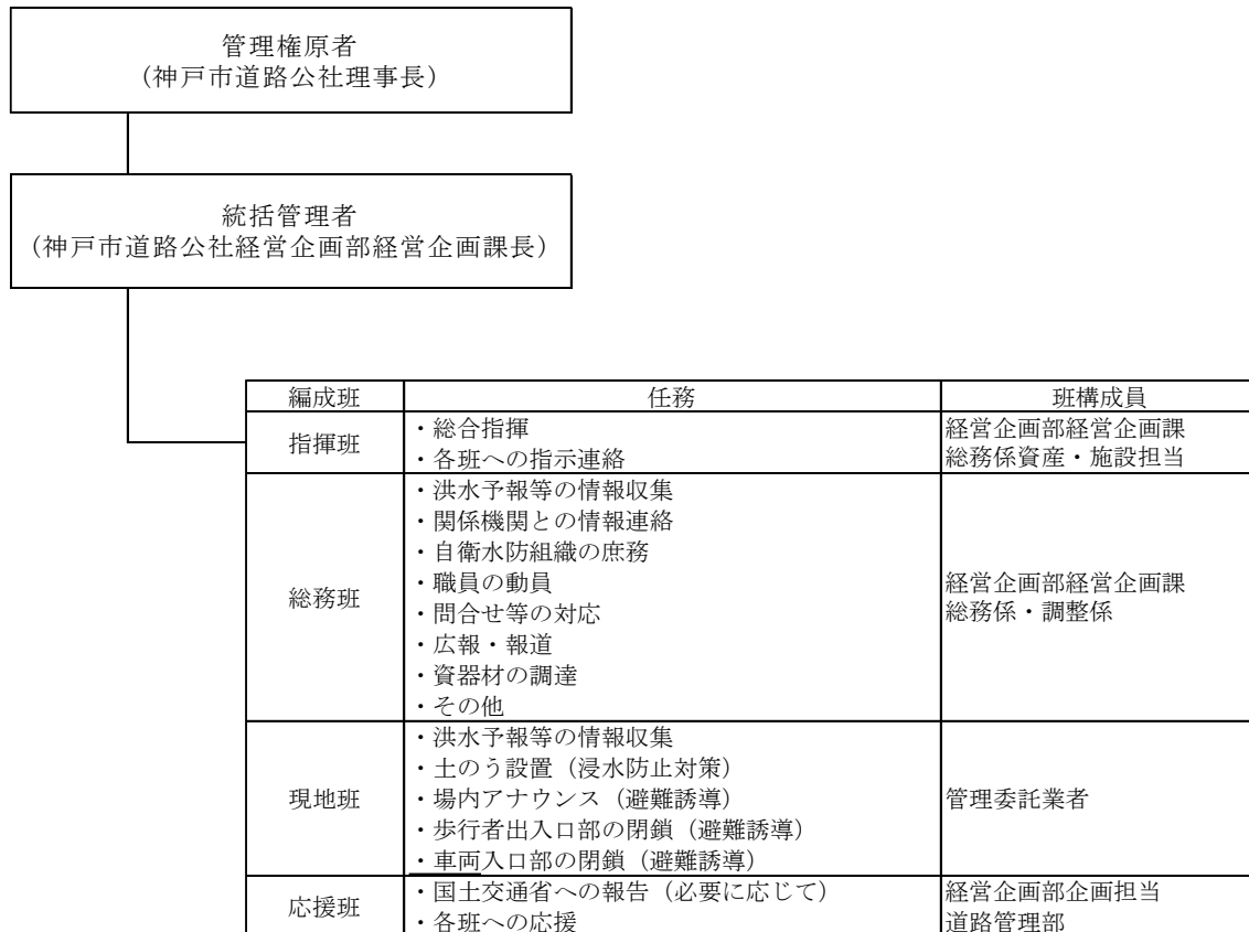
別表1「自衛水防組織活動任務」